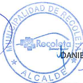
DANIEL JADUE JADUE ALCALDE